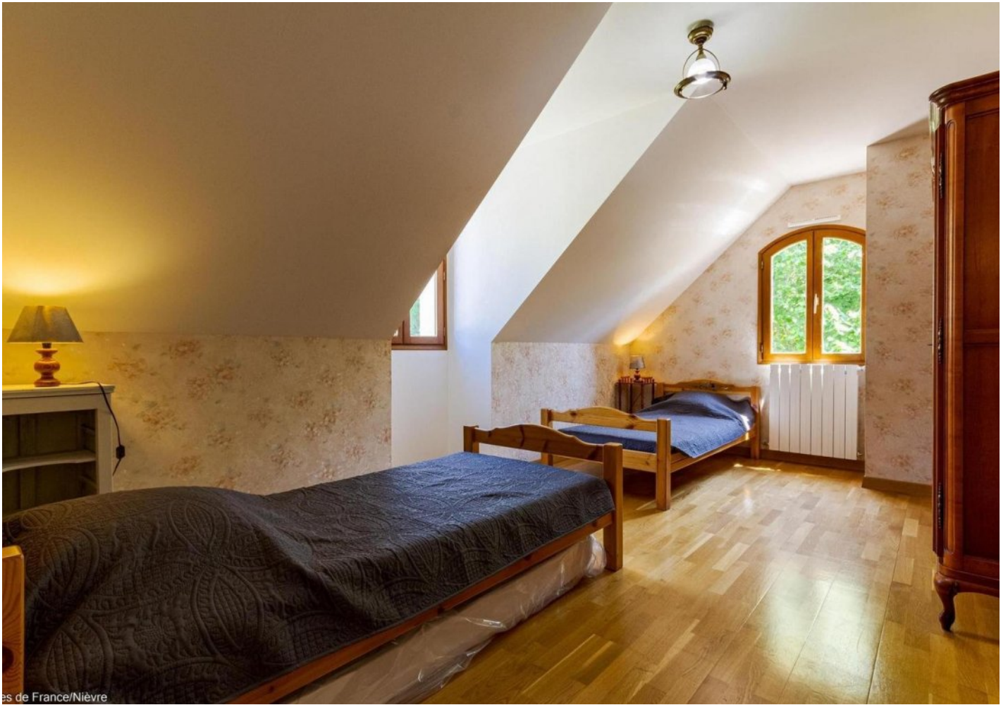
es de France/Nièvre